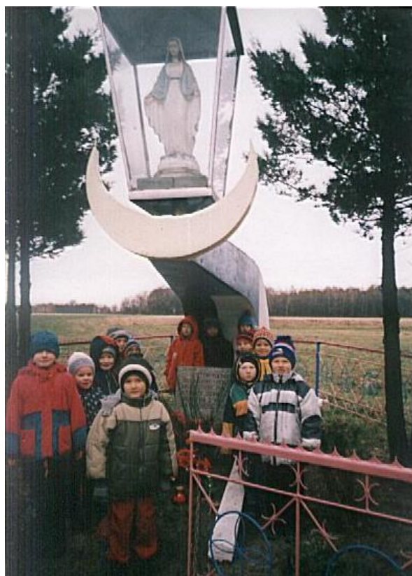
Fot. Pomnik –kapliczka w Wólce Ostrożeńskiej

Pomnik z figurą Matki Boskiej umieszczonej w księżycu w górnej części i płytą upamiętniającą poległych Polaków w czasie okupacji hitlerowskiej w dolnej części pomnika wzniesiony został w 1984 r. w czynie społecznym przez strażaków Ochotniczej Straży Pożarnej w Wólce Ostrożeńskiej.