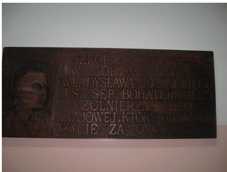
Fot. Tablica pamiątkowa w Szkole Podstawowej w Górznie

Tablica poświęcona Władysławowi Józwickiemu umieszczona została w Publicznej Szkole Podstawowej w Górznie z okazji nadania szkole imienia Władysława Józwickiego ps. „Sęp”. Tablicę zawieszono na szkolnym korytarzu, obok pokoju nauczycielskiego, z napisem: