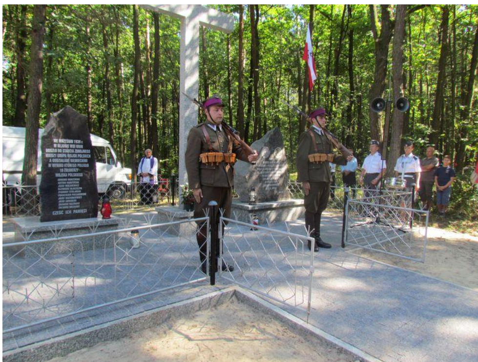
Fot. Warta przy pomniku podczas uroczystości w dniu 4 września 2011 r.