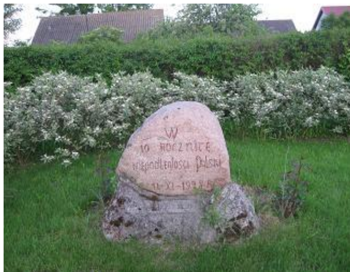
Fot. Kamień przed szkołą w Łąkach już bez dębów.

W 2006 r. dęby zostały wycięte i przeznaczone na ławki do kaplicy w Łąkach, a kamień stoi na placu szkolnym do dziś. 12