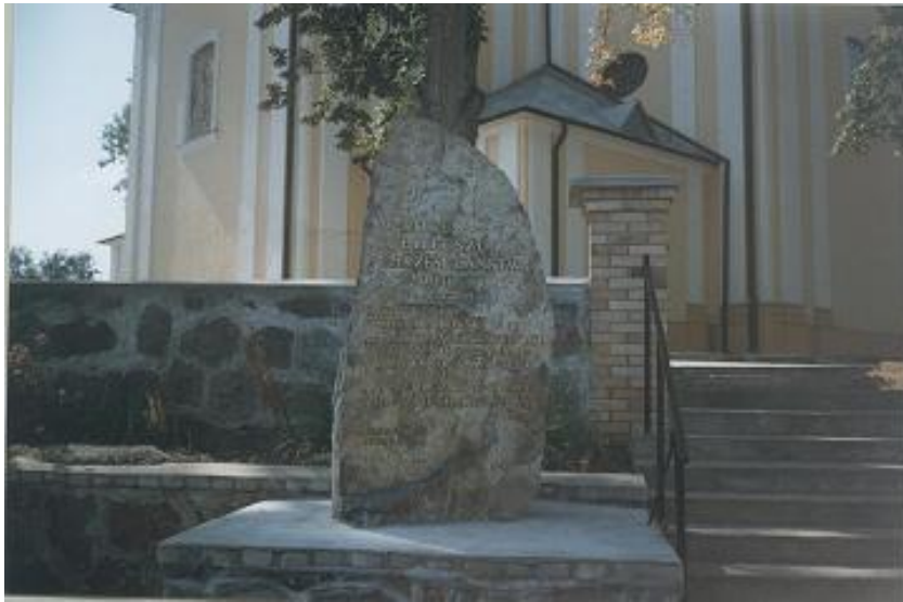
Fot. Kamień pamiątkowy obok kościoła parafialnego w Górznie

Obelisk poświęcony jubileuszowi 1000-lecia chrztu Polski, wizycie Ojca Świętego Jana Pawła II w Siedlcach w 1999 i Misjom Ewangelizacyjnym w parafii Górzno, które odbyły się w dniach 7-15 maja 1998 r. ufundowany został przez parafian. 19