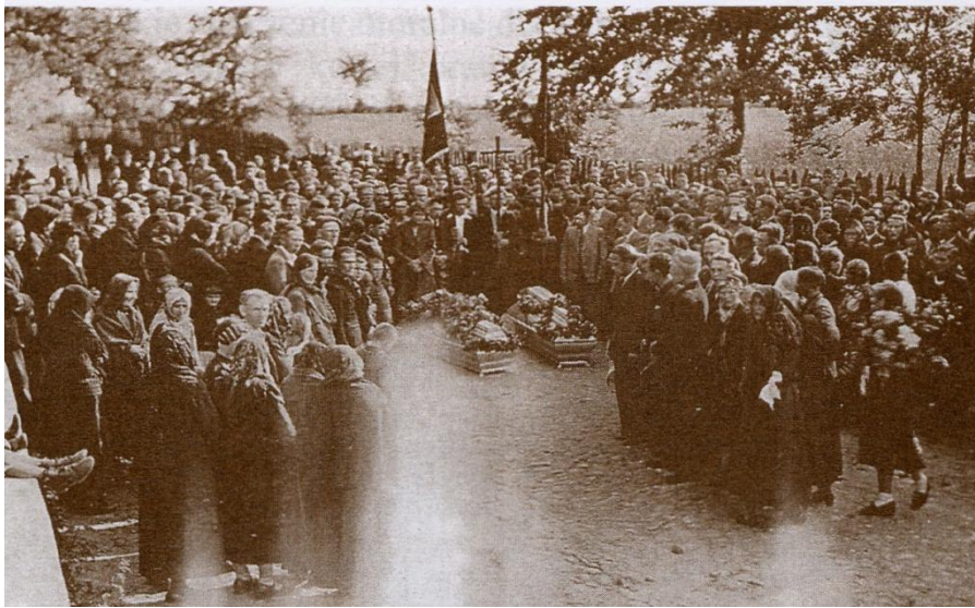
Fot. Pogrzeb poległych żołnierzy AK w 1943 r.

Uroczysty pogrzeb dwóch poległych żołnierzy AK, będący rodzajem manifestacji politycznej odbył się 15 czerwca 1943 r. na Nowym cmentarzu.