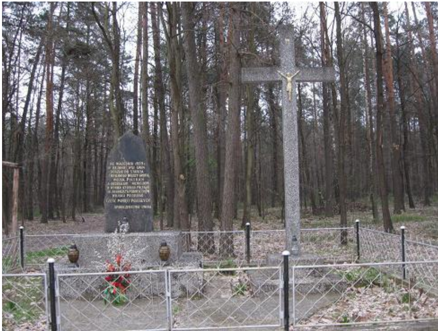
Fot. Pomnik ku czci żołnierzy poległych w lesie w Uninie – stan na 2010 r.

Pomnik w formie obelisku betonowo- marmurowego z dużym krzyżem lastrykowym obok i wyrytym napisem na płycie: