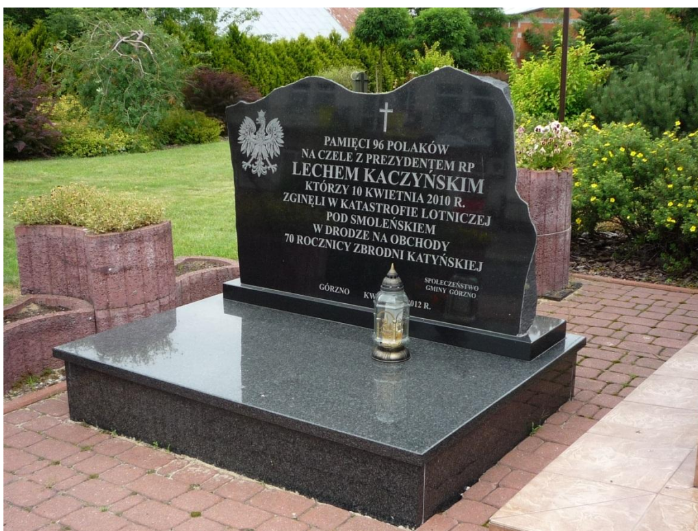
Pomnik poświęcony ofiarom tragedii smoleńskiej z 2010 r. przed Urzędem Gminy w Górznie