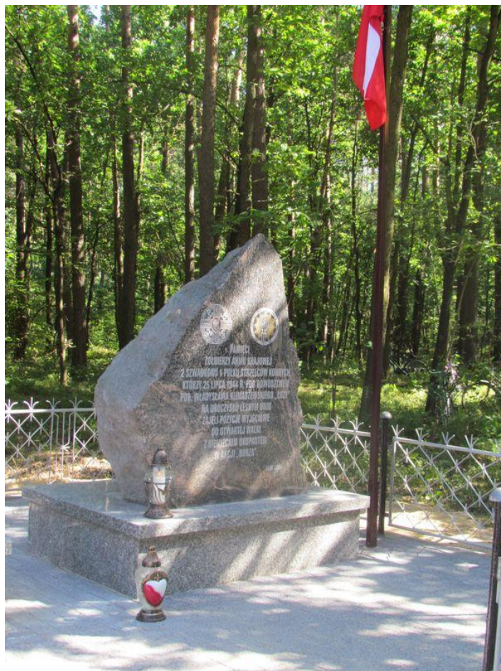
Fot. Pomnik pamięci żołnierzy Armii Krajowej w lesie w Uninie po odrestaurowaniu.