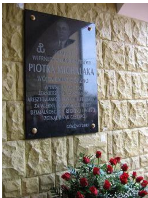
Fot. Tablica poświęcona Piotrowi Michalakowi przy wejściu do Urzędu Gminy w Górznie

Tablica umieszczona przy wejściu do Urzędu Gminy w Górznie poświęcona wiernemu patriocie Piotrowi Michalakowi, wójtowi Gminy Górzno, który w 1944 r. oddał swe życie za ojczyznę. Rozstrzelany w Garwolinie, prawdopodobnie po 6 lipca 1944 r. wraz z grupą 30 więźniów. 17