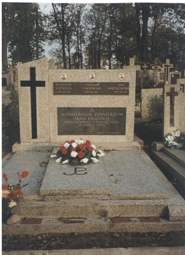
Fot. Mogiła zbiorowa żołnierzy AK na Nowym cmentarzu

Mogiła na Cmentarzu Parafialnym w Górznie (Nowy cmentarz) z pomnikiem o wym. 3x4.5m, wykonanym z płyty z lastryka z płytami szklanymi i krzyżem 1 .