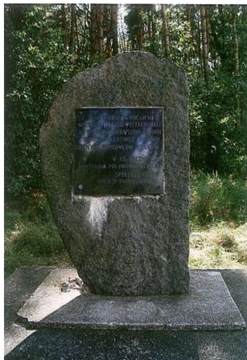
Fot. Pomnik ku czci pilotów w Kobylej Woli

Pomnik, który powstał w 1964 r. zlokalizowany jest przy drodze Kobyla Wola-Wola Rowska 10 .