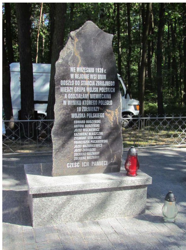
Fot. Pomnik ku czci żołnierzy poległych w lesie w Uninie po odrestaurowaniu.

W 2011 r. oba pomniki zostały odrestaurowane i umieszczone razem po prawej stronie drogi Reducin - Unin. Poświęcenia dokonał ks. prałat Ryszard Andryszczak podczas corocznej Mszy Św. w dniu 4 września 2011 r.