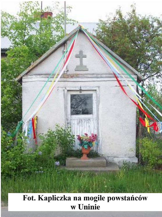
Fot. Kapliczka na mogile powstańców w Uninie

W rejonie wsi Unin w 1863 r. w czasie powstania styczniowego pogrzebanych zostało