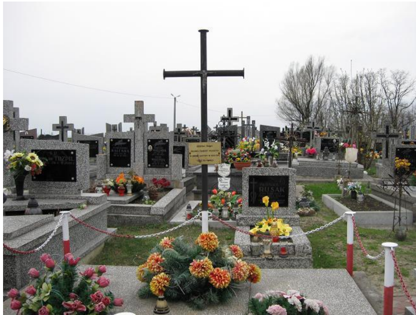
Fot. Mogiła zbiorowa żołnierzy na Starym cmentarzu w Górninie

Mogiła na Cmentarzu Parafialnym w Górninie (Stary cmentarz) z napisem: „ Zbiorowa mogiła polskich żołnierzy poległych w obronie ojczyzny w 1939 roku. Cześć ich pamięci ”