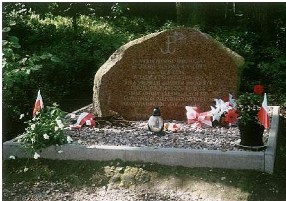
Fot. Pomnik w „Uroczysku Dębczyna”

Pomnik upamiętniający miejsce ukrywania się żołnierzy i partyzantów w czasie II wojny światowej znajduje się w środku lasu w odległości 2 km od Kobylej Woli. Na pomniku widnieje napis: „Ta nieruchomości hipoteczna pn. „Osada Młyńska Ignaców” tzw. Dębczyna w latach okupacji 1939-1945 była miejscem zbornym żołnierzy Oddziałów Partyzanckich AK oraz ostoją ukrywających się uczestników niepodległościowego podziemia obwodu „Gołąb” Garwolin. Ignaców 2 IX 2007” . Teren ten, gdzie znajduje się pomnik należy obecnie do Józefowa.