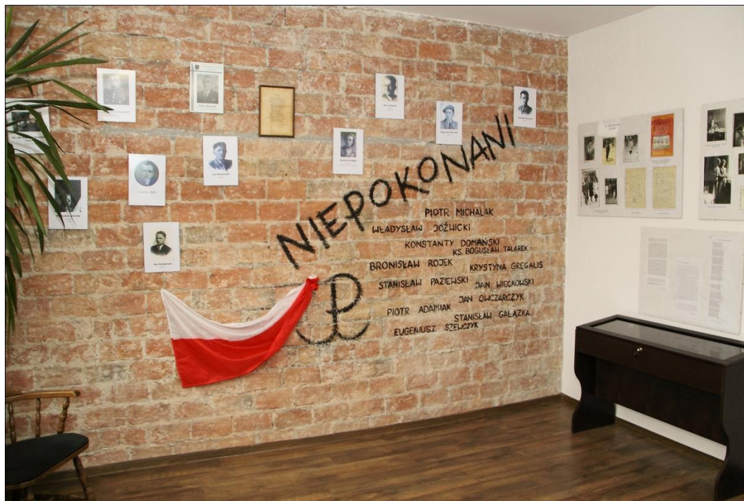
Fot. Pamiątkowa ściana w Izbie patriotycznej