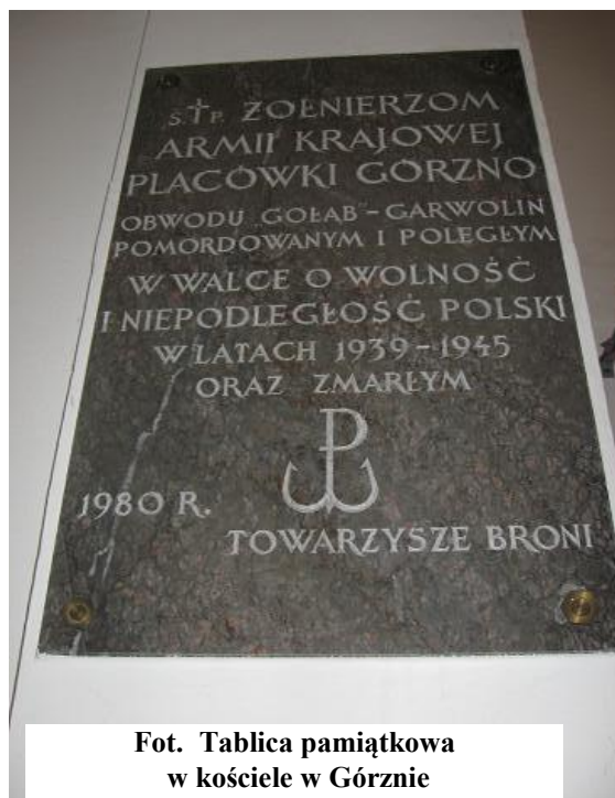
Fot. Tablica pamiątkowa w kościele w Górznie

W dniu 20 sierpnia 1980 r. ks. kard. Stefan Wyszyński wydał dekret zezwalający na wmurowanie tablicy pamiątkowej w kościele parafialnym w Górznie 16 .