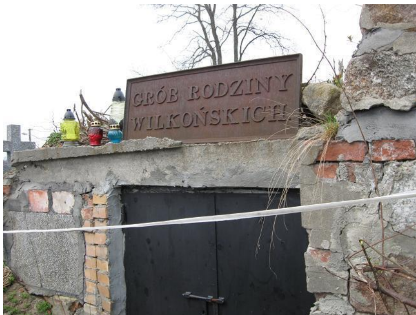
Fot. Grobowiec po przebudowie w 2009 r.

Pieczara w 2009 r. została przebudowana przez ks. Eugeniusza Rolę w związku z jej złym stanem, grożącym zawaleniem, a następnie rozebrana. Na tym miejscu postawiono nowy pomnik. Obecnie nie figuruje w rejestrze zabytków.