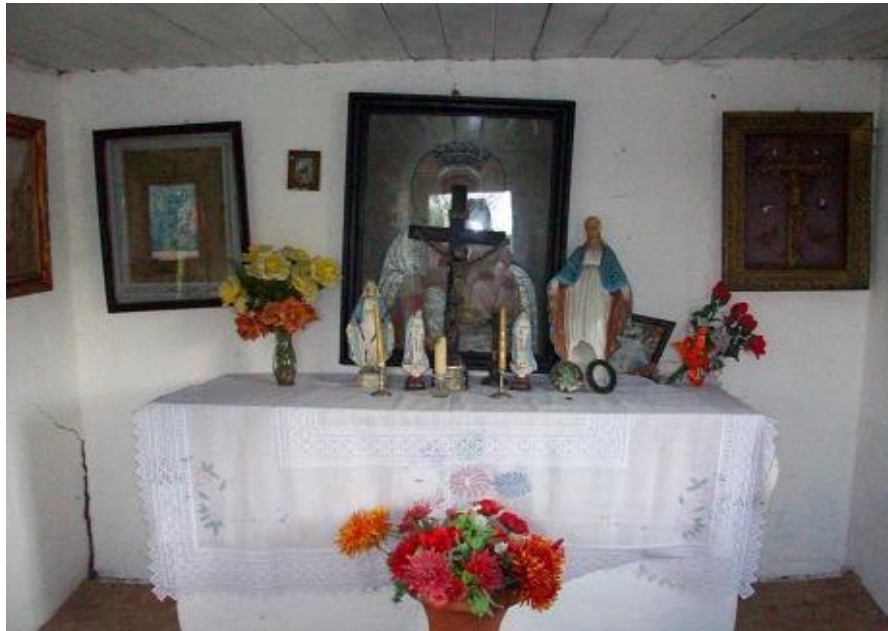
Fot. Obrazy i figurki w kapliczce w Uninie

Wg relacji Feliksa Przybysza: „Miejsce to do dziś służy jako zabytek sakralny, gdzie wierni odprawiają modły i inne uroczystości” 7 .