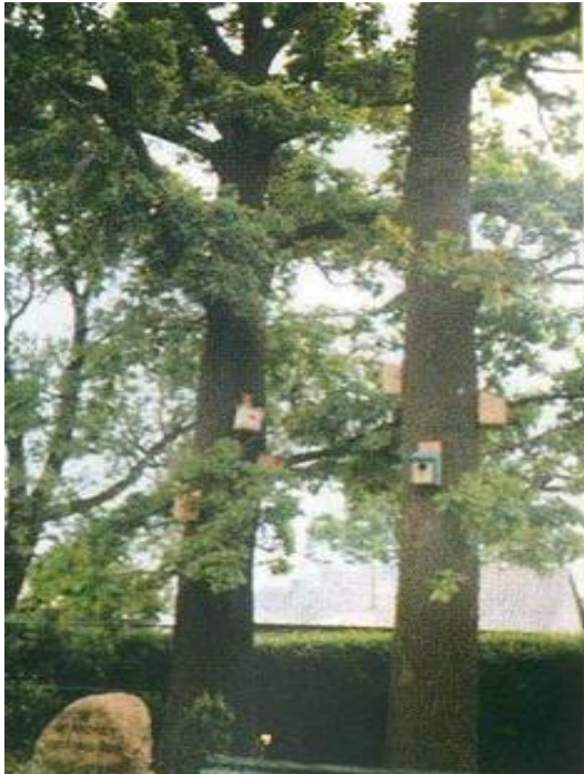
Fot. Pamiętkowy kamień i 3 dęby