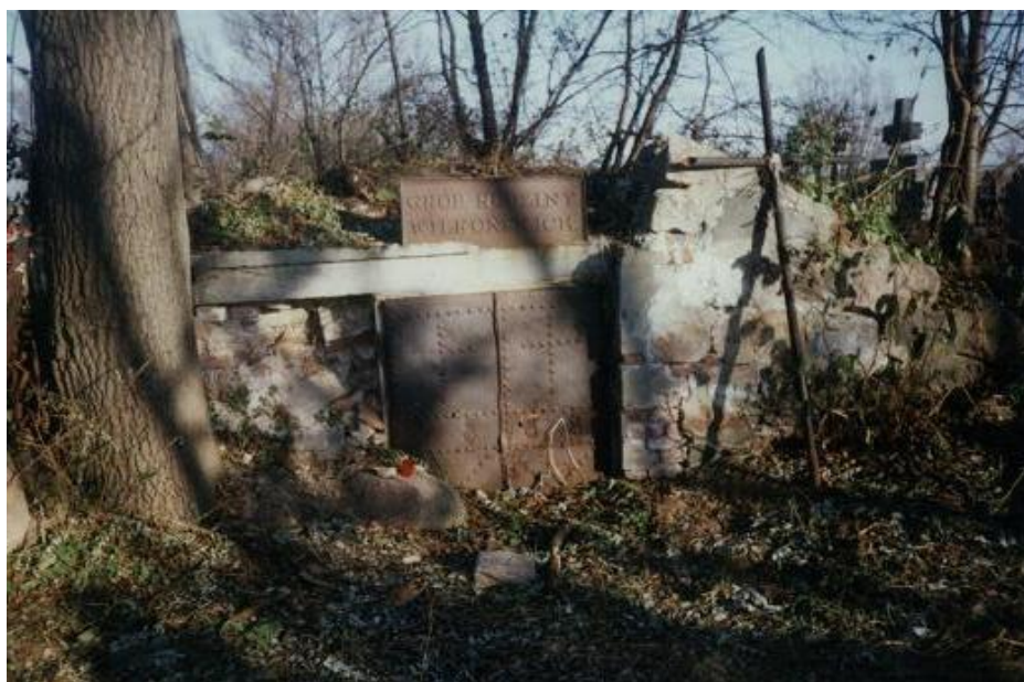
Fot. Grobowiec rodziny Wilkońskich przed przebudową

Grobowiec rodziny Wilkońskich z 1866 r., zarządców Górzna w latach 1864-1920 15 .