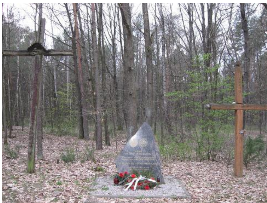
Fot. Pomnik pamięci żołnierzy Armii Krajowej w lesie w Uninie – stan na 2010 r.

Pamiątkowy obelisk kamienny z napisem na płycie: „Pamięci żołnierzy Armii Krajowej 2 Szwadronu 1 Pułku Strzelców Konnych, którzy 25 lipca 1944 r. pod dowództwem por. Władysława Klimaszewskiego „Łozy” na Uroczysku Leśnym Unin zajęli pozycje wyjściowe do otwartej walki z niemieckim okupantem w akcji „Burza” znajduje się po przeciwnej stronie drogi, co pomnik ku czci żołnierzy poległych w 1939 r.