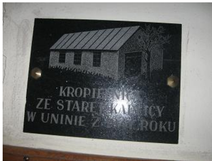
Fot. Tablica pamiątkowa do kropielnicy ze starej kaplicy w Uninie

Kropielnica umieszczona w nowym kościele w Uninie, po prawej stronie od głównego wejścia, a nad nią tablica pamiątkowa.