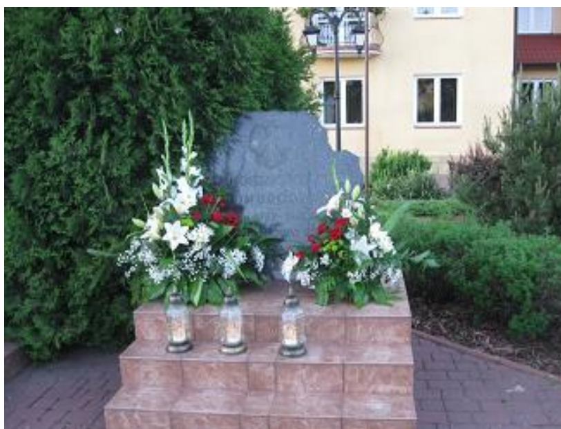
Fot. Obelisk przed Urzędem Gminy w Górznie

Obelisk znajdujący się przed budynkiem Urzędu Gminy w Górznie, obok zabytkowej kapliczki postawiony został w latach 80-tych XX wieku.