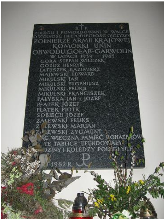
Fot. Tablica poświęcona żołnierzom AK w kościele w Uninie

Tablica poświęcona poległym i pomordowanym żołnierzom Armii Krajowej.